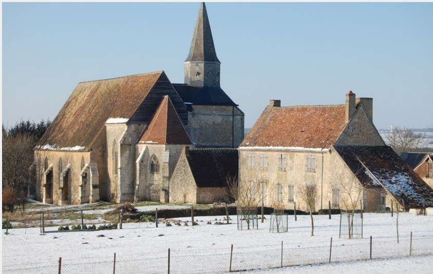
L'église et le presbytère d'Argenvilliers sous la neige (Parc du Perche)