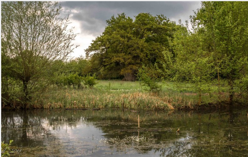
La Lambonnière (Didier Orsal)