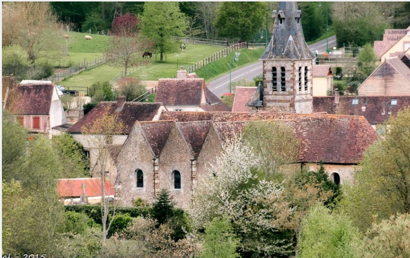
2015 La Madeleine-Bouvet