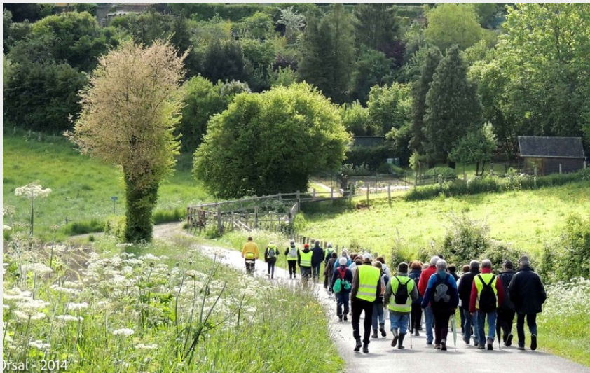
Orsal - 2014 Arrivée à Mortagne-au-Perche (Didier Orsal)