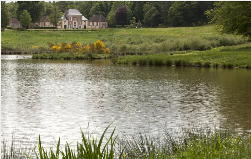
La porterie de la Chartreuse du Val-Dieu