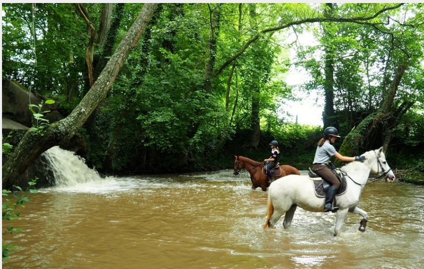
Chute d'eau de Beillard

Communauté de Communes du Pays de Mortagne au Perche - La Chapelle-Montligeon