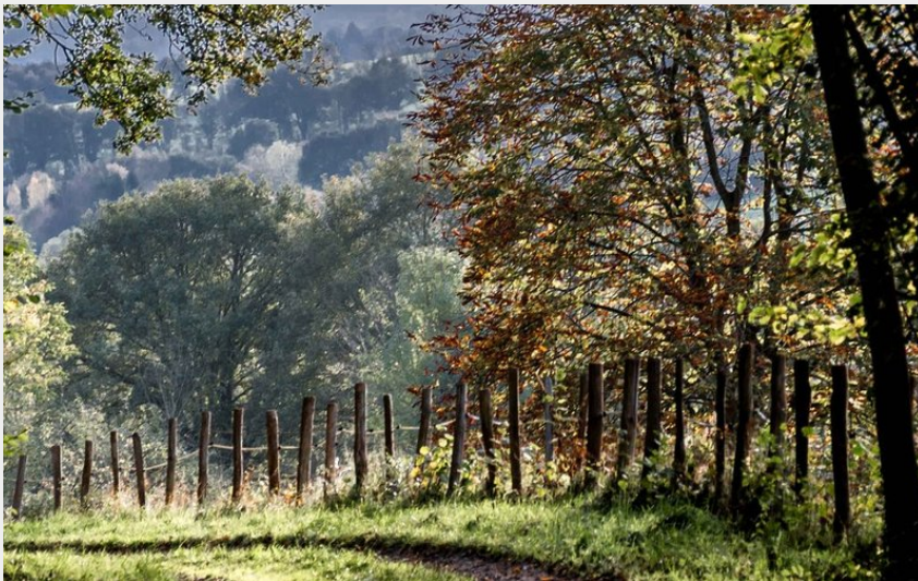
La ligne du tram à l'orée de la forêt