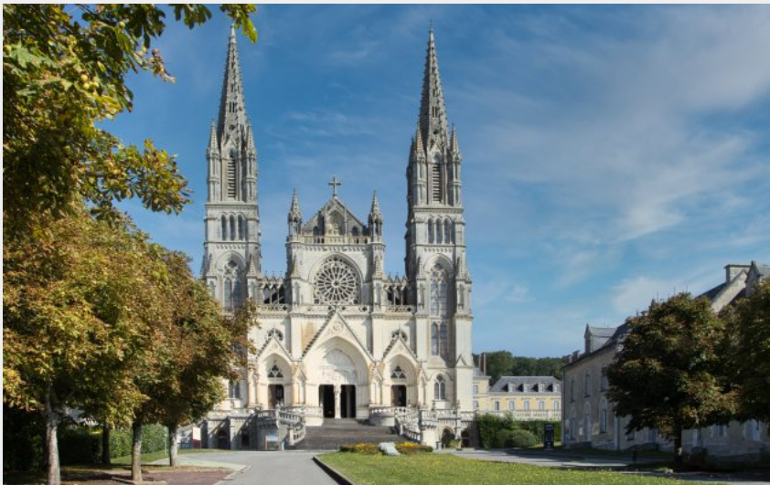
Basilique Notre-Dame de Montligeon (Didier Orsal)