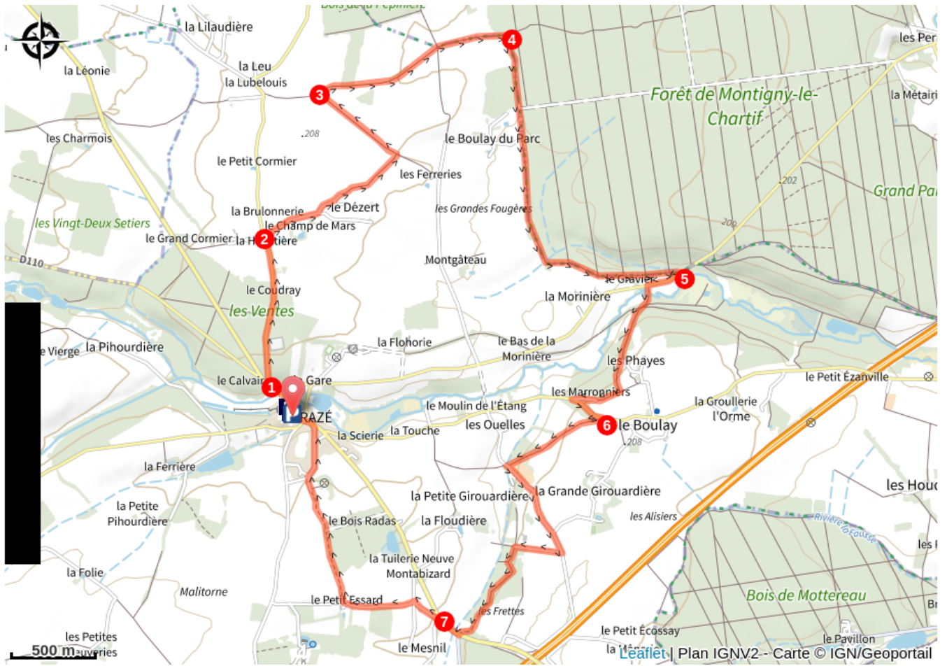
Synthèse communale (A)