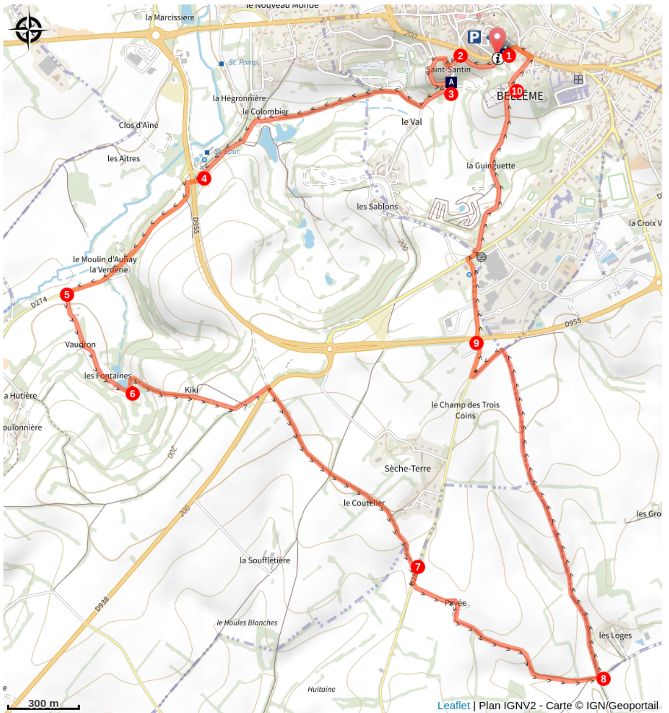
La Chapelle Saint-Santin (A)