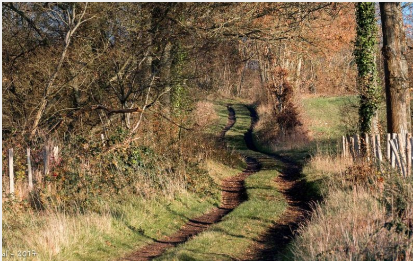
al - 2017