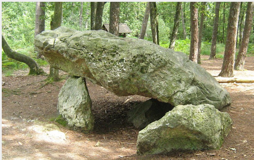
La Pierre Procureuse

Communauté de Communes Cœur du Perche - Saint-Cyr-la-Rosière