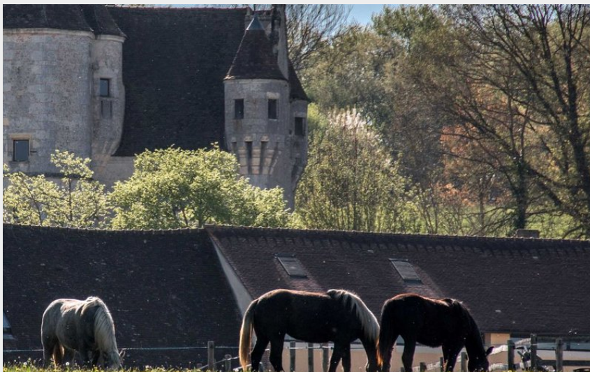
Manoir de Courboyer