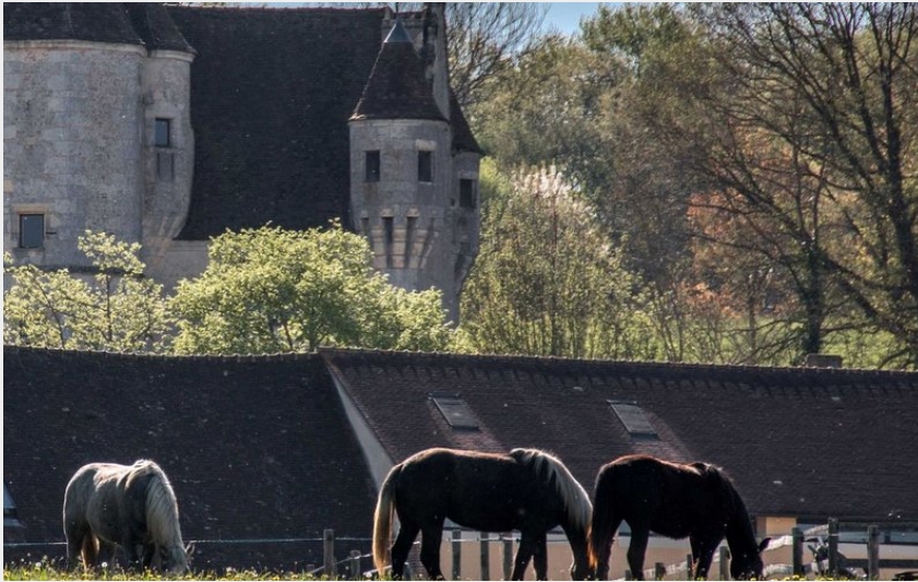
Manoir de Courboyer