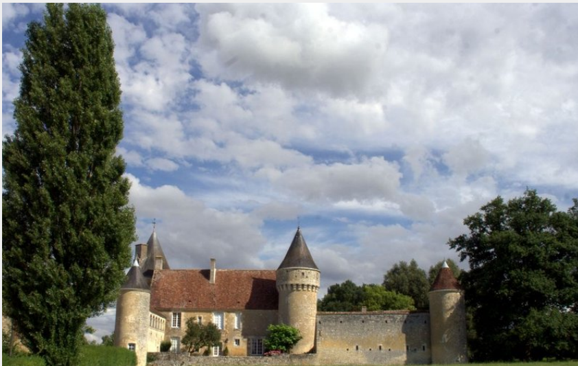
Manoir de l'Angenardière