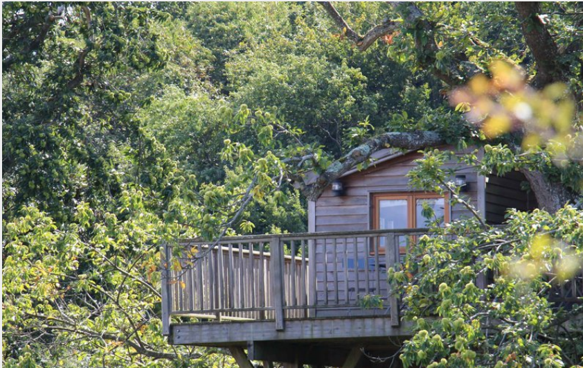
Cabane dans les arbres-Perché dans le Perche-Bellou-le-Trichard (admin-pnrp)