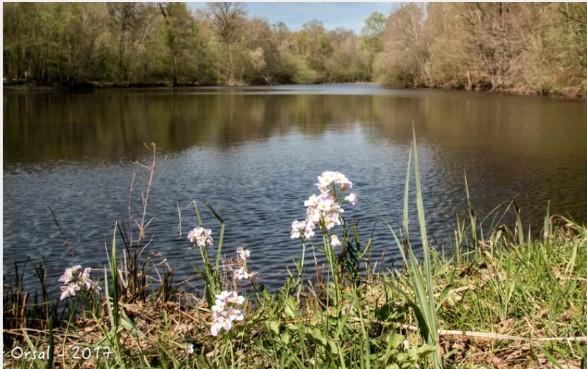
L'étang du Val