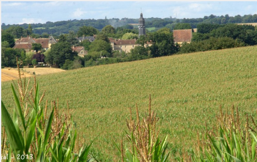
juin 2013 St-Cyr-la-Rosière