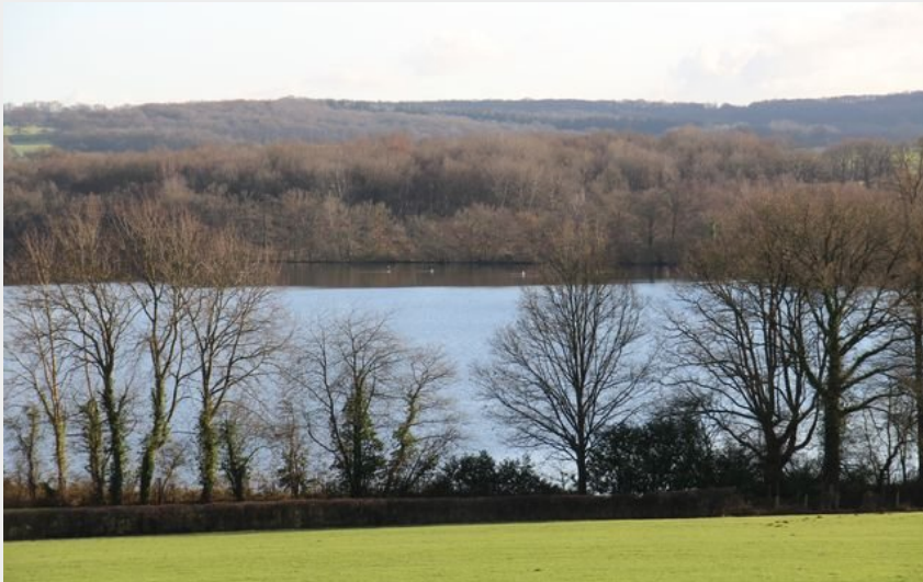
Etang de Perruchet@Jémérie Guy-PNRP (admin-pnrp)