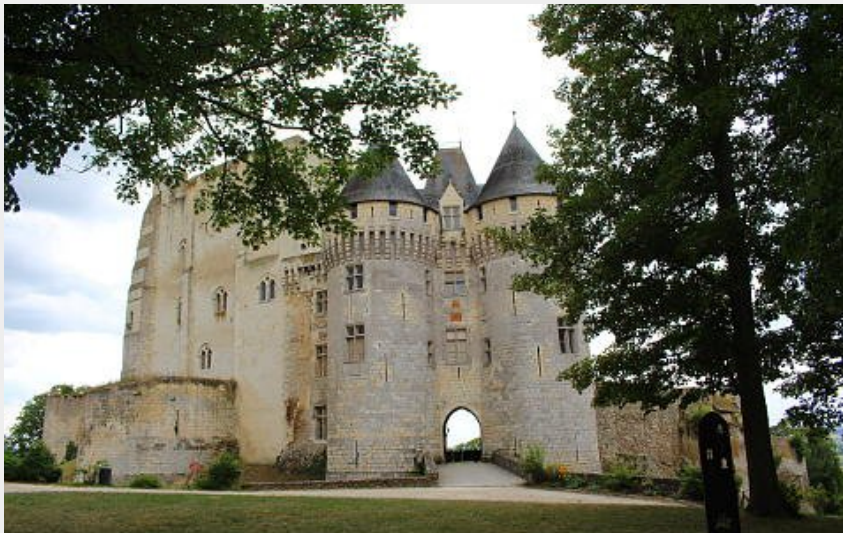
Château des comtes du Perche-Nogent-le-Rotrou (admin-pnrp)