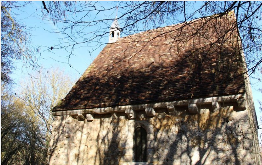
Chapelle de St-Hilaire-des-Noyers