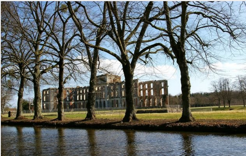
Parc et château de la Ferté-Vidame