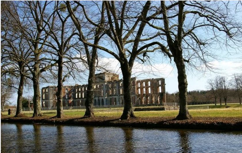
Parc et château de la Ferté-Vidame