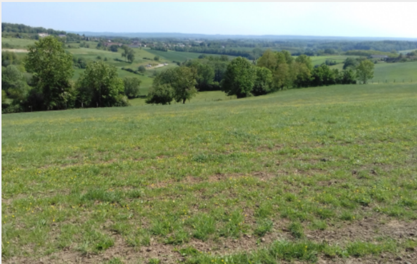
Point de vue (CdC Bassin de Mortagne-au-Perche)