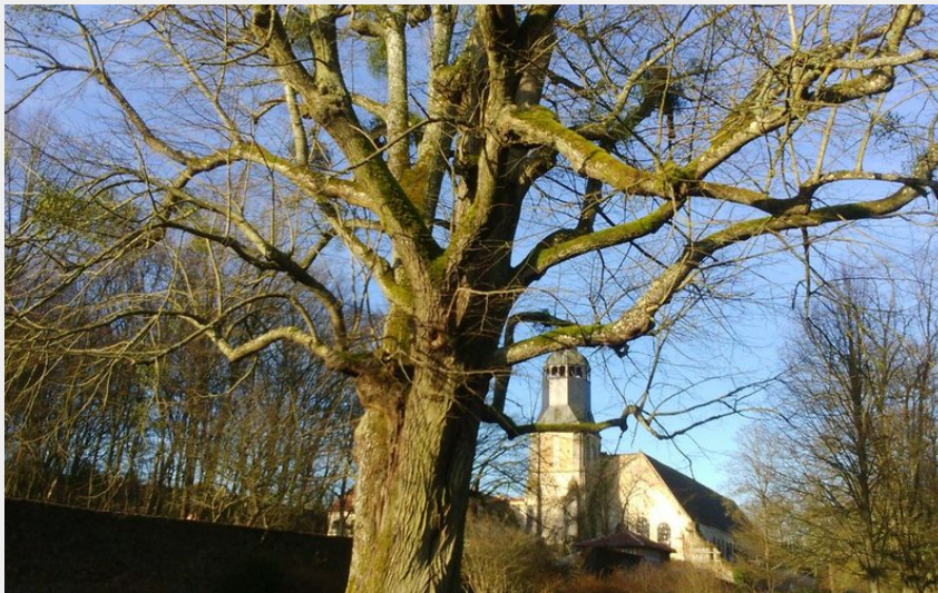
Tilleul labellisé-Parc de l'abbaye