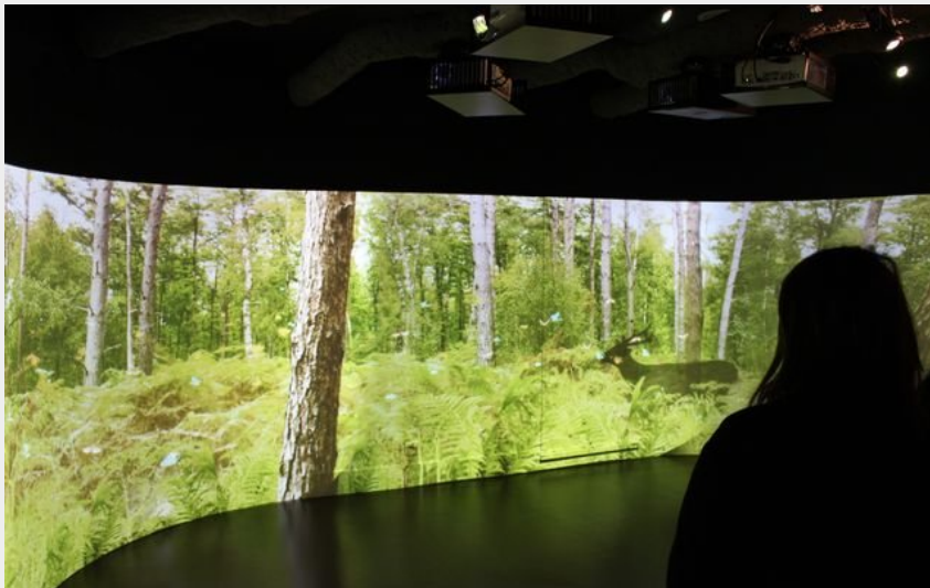
Musée Forêt d'Histoires (admin-pnpr)