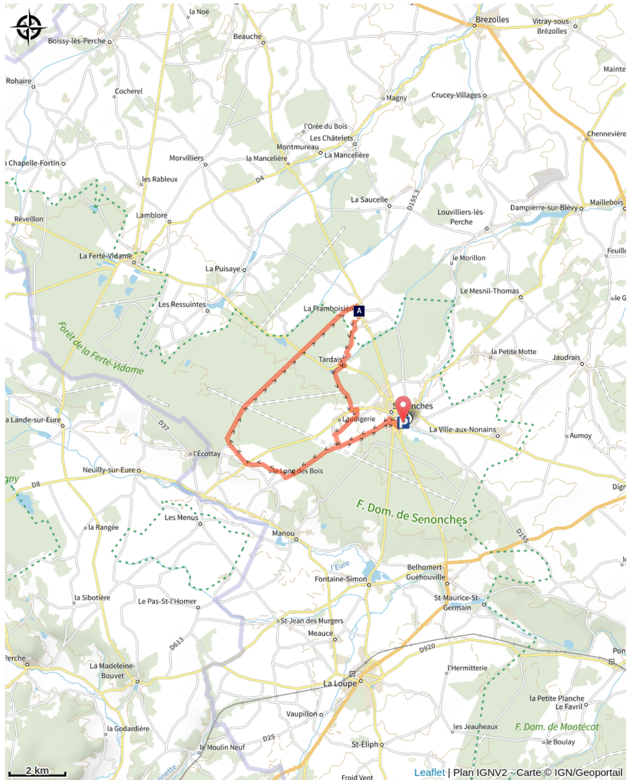
L'église Sainte-Marie-Madeleine (A)