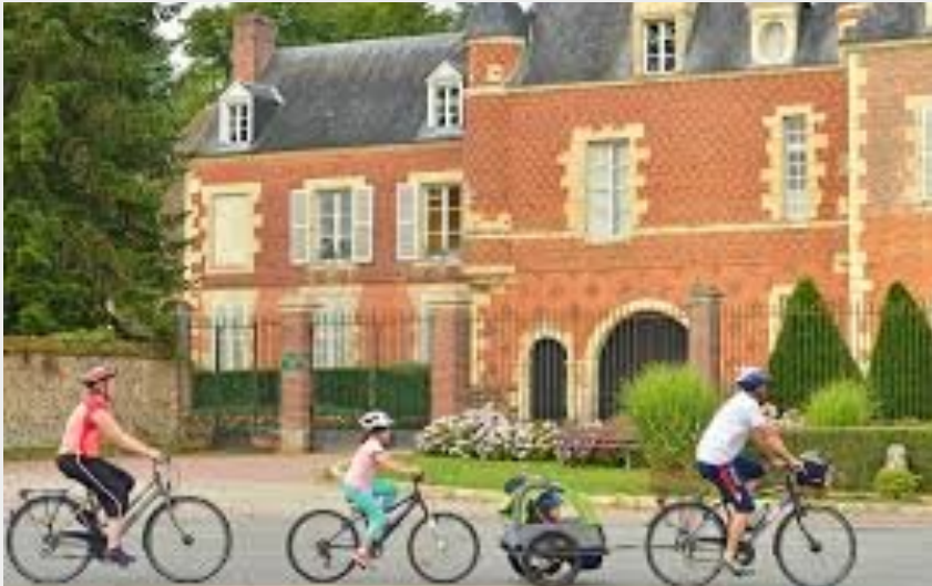
Frazé à vélo

Communauté de Communes Terres de Perche - Brou