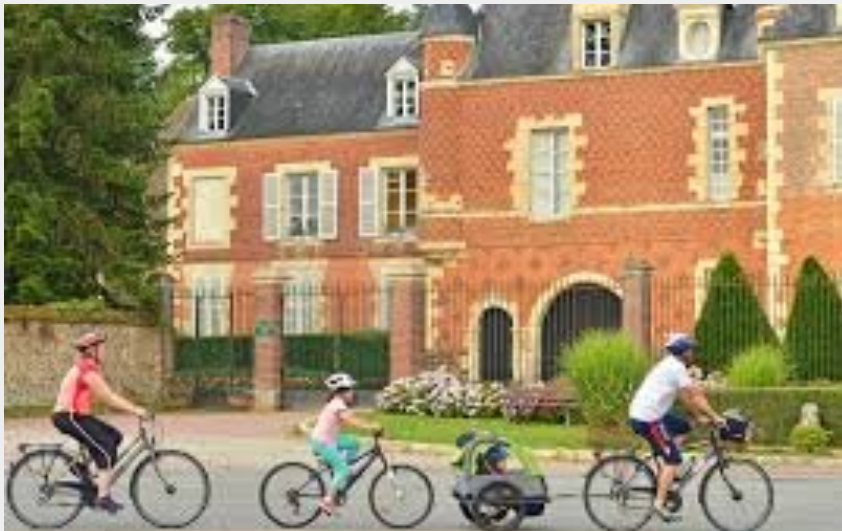
Frazé à vélo

Communauté de Communes Terres de Perche - Brou