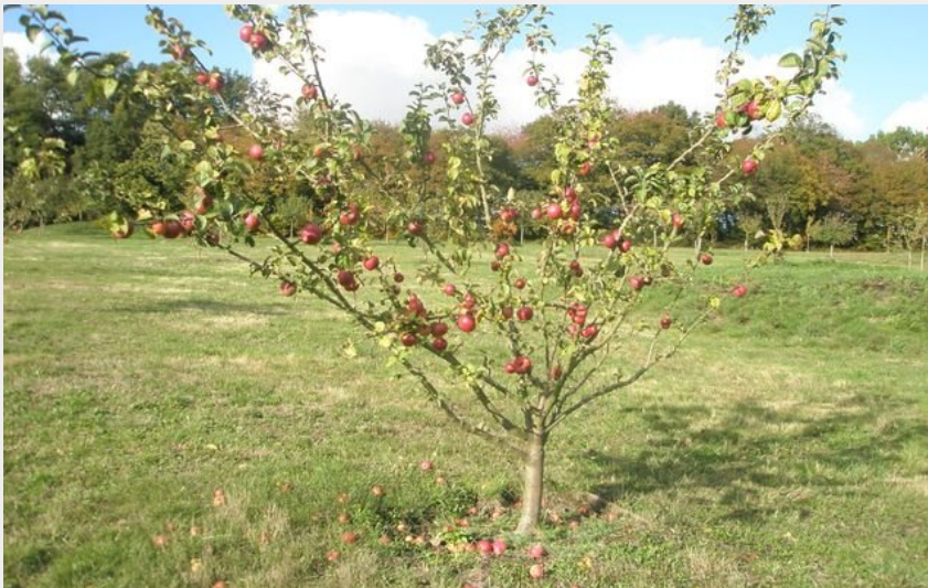
Arboretum de Miermaigne-OT Perche (admin-pnrp)