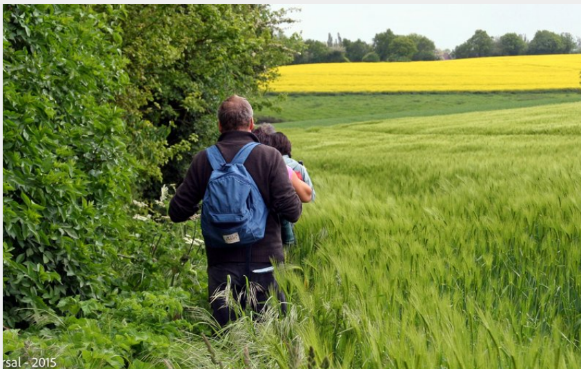
Orsal - 2015 (Didier Orsal)

Communauté de Communes des Collines du Perche Normand - La Perrière