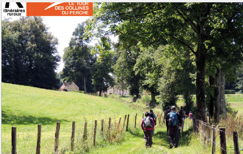
(Didier Orsal 2014)

Communauté de Communes du Perche - Nogent-le-Rotrou