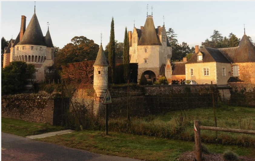
Château de Frazé