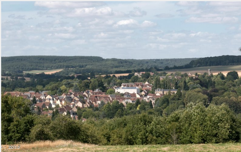
Rémalard (Didier Orsal)